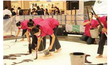
鳳凰高等学校書道部 書道パフォーマンス