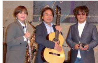
Yoshi's ボサノヴァ・トリオ