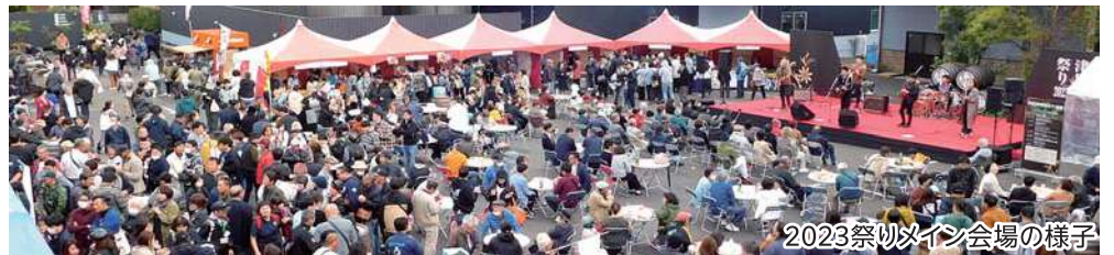
2023祭りメイン会場の様子